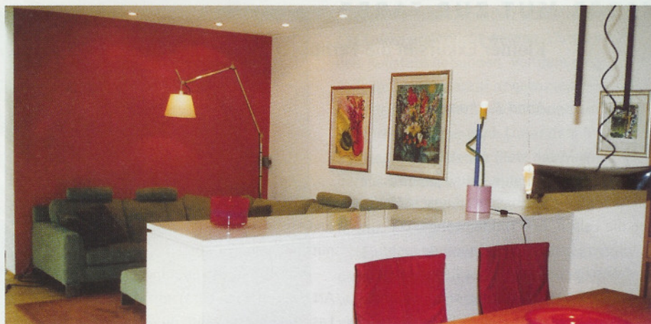
Der warme Rotton dieser Wand bildet einen Kontrast zu einer gegenüber liegenden Glasfront und erzeugt hier eine angenehme Atmosphäre.

Absolute Unikate. Eine Art Krönungsstoff.