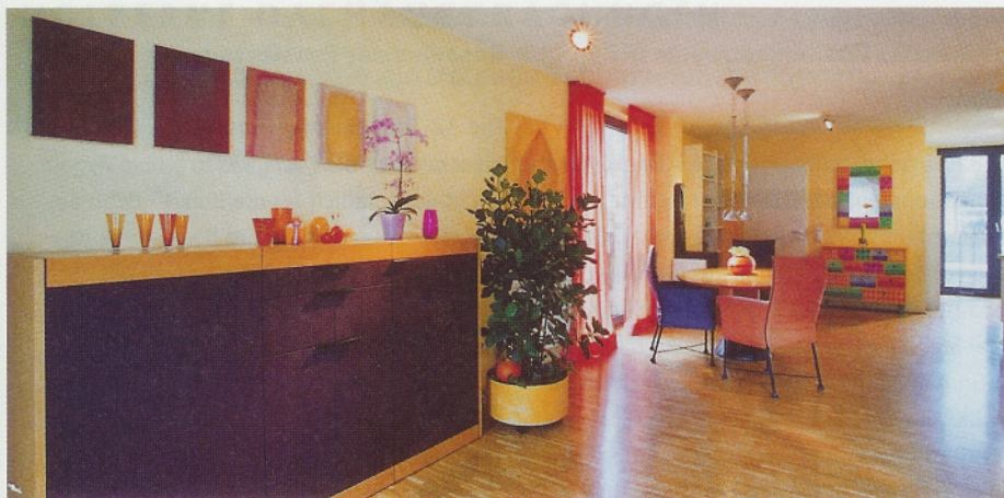
Das Wohnzimmer erhält durch die Wahl klarer und warmer Farben eine besondere Leuchtkraft, die Behaglichkeit schafft.

hat keinen Halt mehr. So gibt es beispielsweise in der Natur kein Weiß als Boden. Daher gehen wir über Weiß vorsichtiger, als etwa über Braun.