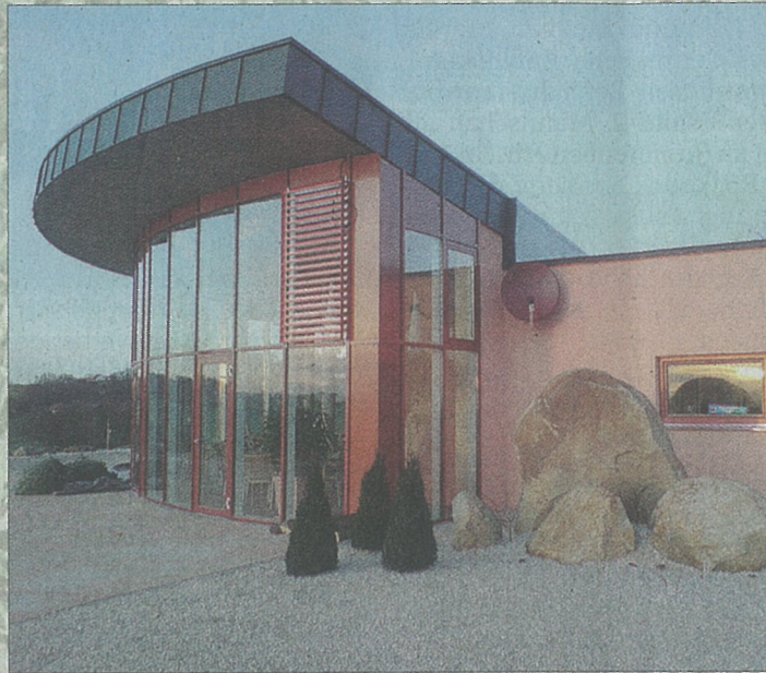
Das herrlich gelegene Clubhaus des ersten Feng Shui Golfplatzes Deutschlands in Fürstencell.

Das Clubhaus wurde bewusst auf dem Plateau am Bromberg aufgebaut. Es entstand ein Gebäude mit einer Muschelform, dessen helle Farben, klare Formen und natürliche Materialien die Harmonie bestimmen. Bau und Ausstattung sind nach Feng-Shui-Kriterien gestaltet und eingerichtet.